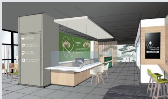
Centre dentaire : rue Magellan, Espace Xenon, ZI du pont rouge, Carcassonne

Un concept qui sera également déployé en fin d'année à Perpignan avec l'ouverture d'un 13 e centre dentaire mutualiste.