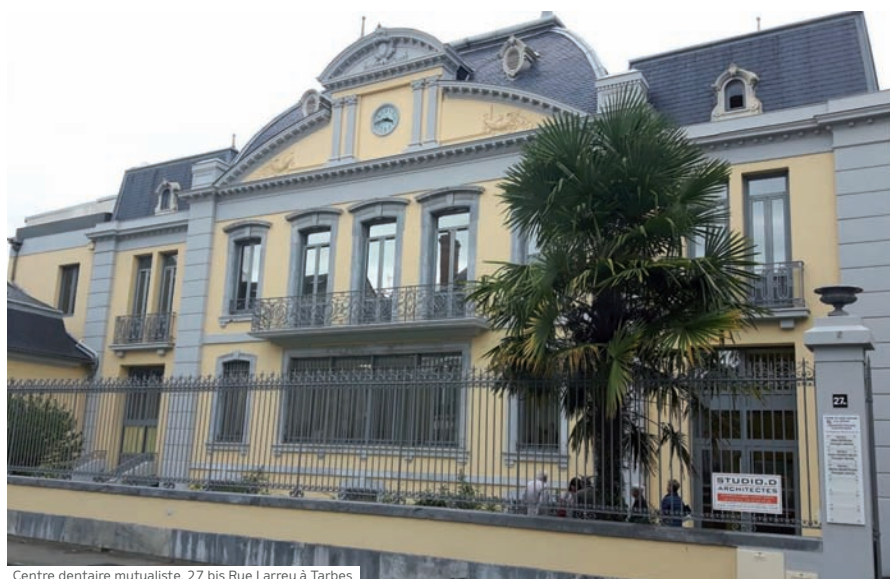
Centre dentaire mutualiste, 27 bis Rue Larrey à Tarbes

« Malgré un contexte de plus en plus difficile, avec notamment la vigilance imposée par le reste à charge zéro et les problèmes de recrutement des