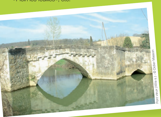
Pont Vieux (XIII e s.)

Retrouvez à Pavie des animations variées tout au long de l'année : fête des crêpes, foire au jardinage, Trad'Envie, festival « Plein les feuilles », etc.