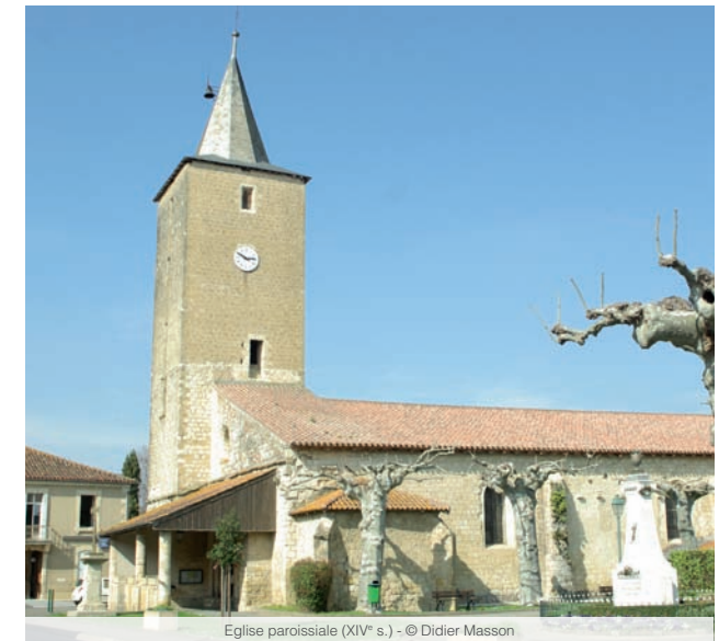
Eglise paroissiale (XIV e s.)