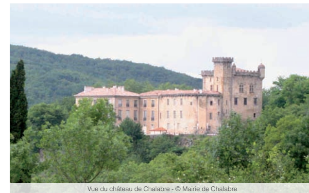
Vue du château de Chalabre