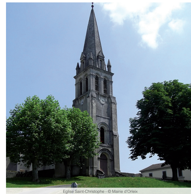
Eglise Saint-Christophe