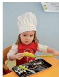
Atelier nutrition : réalisation d'une salade de fruits