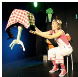
Représentation du spectacle de magie "A table Zoé" de la compagnie Fabulouse