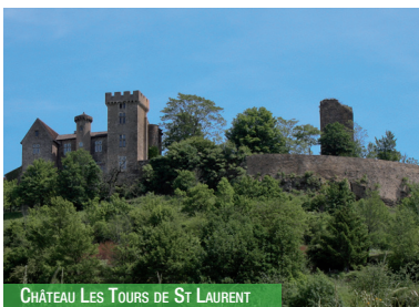
CHÂTEAU LES TOURS DE ST LAURENT