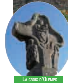
LA CROIX D'OLEMPs