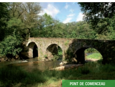
PONT DE COMENCEAU