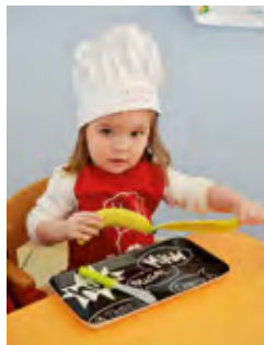
Atelier nutrition : réalisation d'une salade de fruits