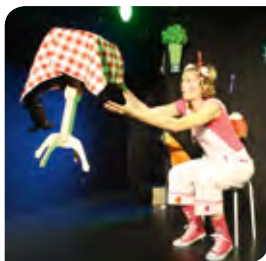
Représentation du spectacle de magie "A table Zoé" de la compagnie Fabulouse